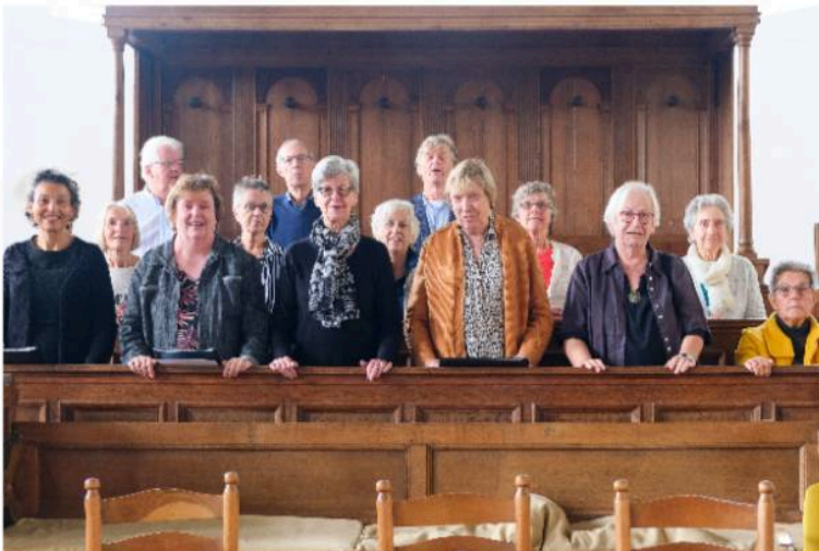
De Cantorij en De Vriendenkring tijdens de Startzondag op 18 september j.l.